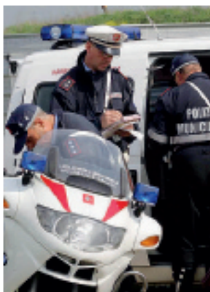
IN MOTO Controlli della polizia municipale

Da un più accurato accertamento dei documenti, è emerso che solo uno dei due cinesi aveva conseguito la patente di guida, pur non